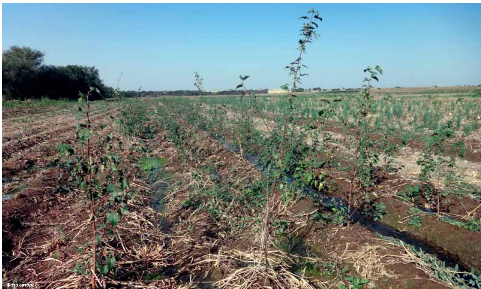
Основная причина ухудшения мелиоративного состояния земель – выход из строя оросительных и дренажных систем.

«В основном почвы засолены в Туркестанской, Алматинской, Жамбылской и Кызылординской областях. Однако у нас нет почвенных и гидрогеологических карт, благодаря которым мы бы