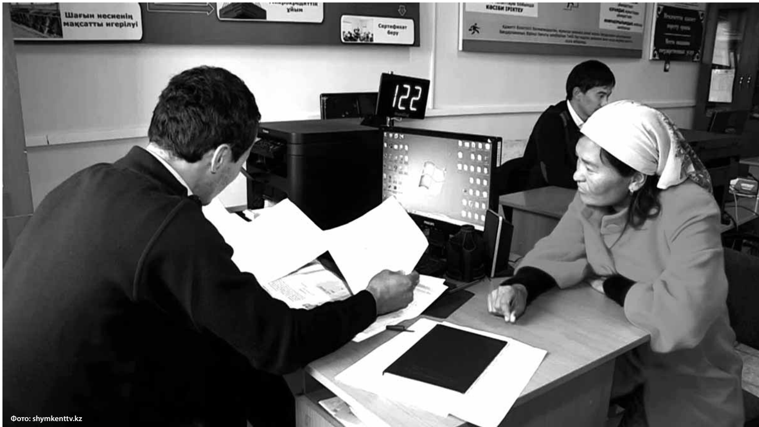
За 17 дней по новым условиям получения АСП центр занятости по городу Таразу принял свыше 4 тыс. заявлений.

Между тем «Курсиву» так и не удалось выяснить, работники какого госоргана принимают решение, может семья получать АСП или нет. К примеру, в горсобесе Тараза утверждают, что это центр занятости. Те же, в свою очередь, указывают на главных инспекторов горакимата. А последние заявляют, что вся эта