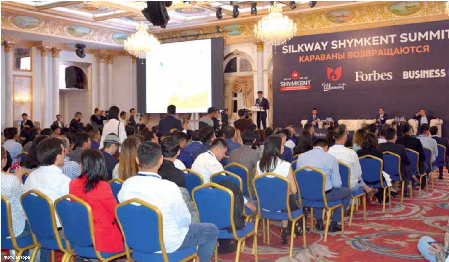
Участники форума Silkway Shymkent Summit рассказывали о том, какого рода бизнес можно и нужно развивать в третьем мегаполисе страны.

Обеспеченность населения жильем в Алматы и Нур-Султане составляет 26 кв. м на человека, а в Шымкенте – 24. Для сравнения: ежегодно в Алматы и Нур-Султане вводится более 2 млн кв. м жилья, тогда как в Шымкенте – 430 тыс.