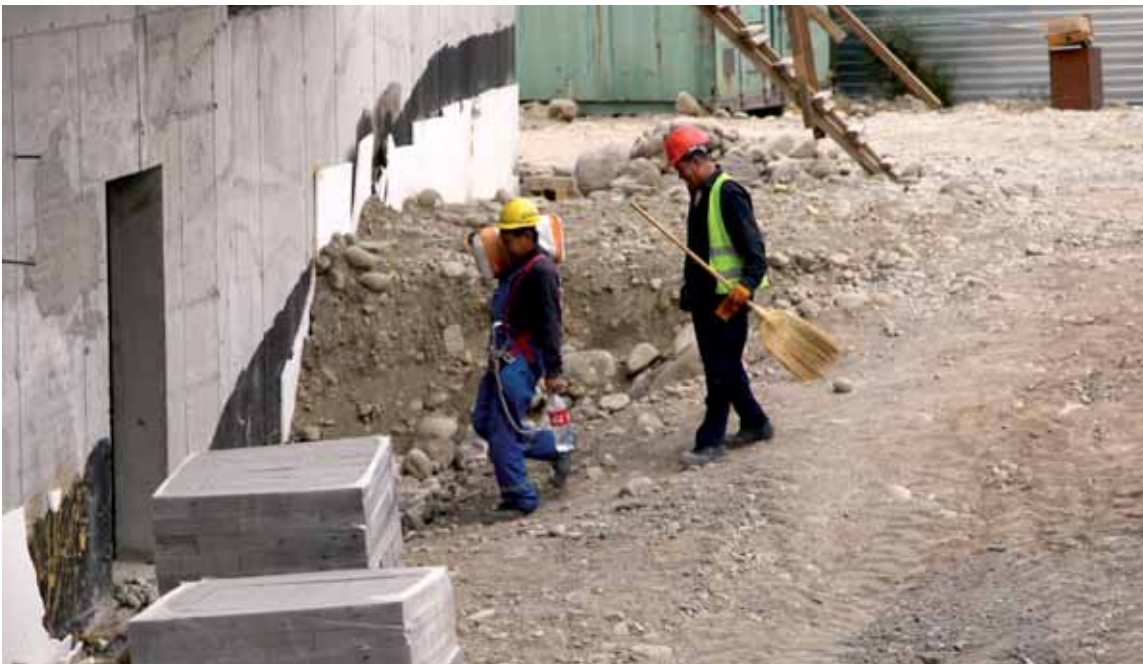
Работодатели не готовы платить потенциальным сотрудникам выше 160–150 тыс. тенге в месяц.

Так, самое выгодное предложение делает ИП «Рекрутинговая компания «Вектор» из города Со-