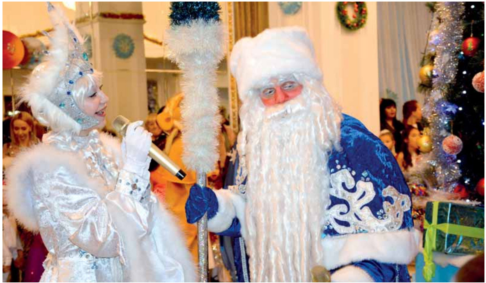
В Шымкенте услуги Деда Мороза стоят от 10 до 50 тыс. тенге.

Но есть в Шымкенте и несколько профессиональных Дедов Морозов, услуги которых стоят дороже, а в дома и на корпоративы они приходят только по рекомендациям или к постоянным клиентам.