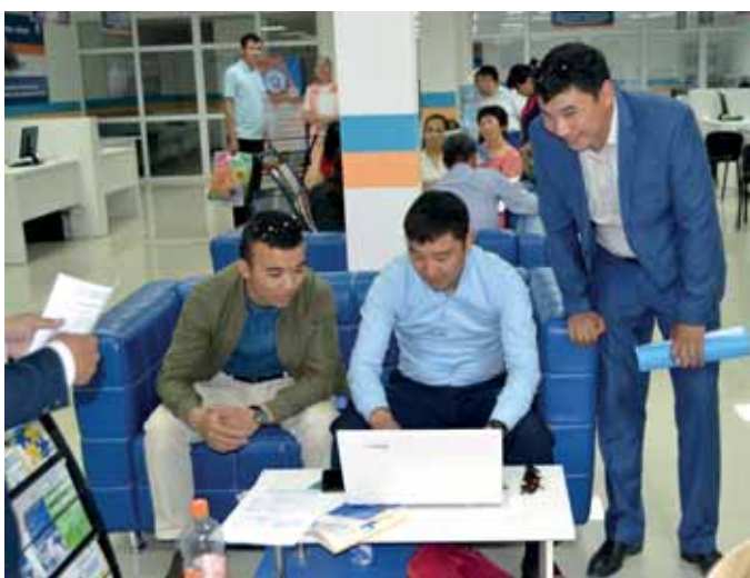
В планах сотрудников областного управления предпринимательства и туризма реализовать проекты по пяти действующим направлениям.

Чтобы поддержать действующих предпринимателей и создать условия для новых, в Кызылорде открыли Дом