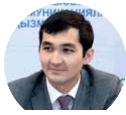
«Костанайцы смогут вылетать из аэропорт в Астаны, Актобе или Челябинска».

«Стоимость работ на 2018 год – 4,6 млрд тенге. На 2019 год остается 3,5 млрд тенге. После завершения реконструкции и внедрения международных стандартов на взлетно-посадочных площадках и в терминалах наша воздушная гавань станет принимать больше рейсов. Уже ведутся переговоры с компанией Air Astana по полетам в Ганновер не только летом, но и зимой.