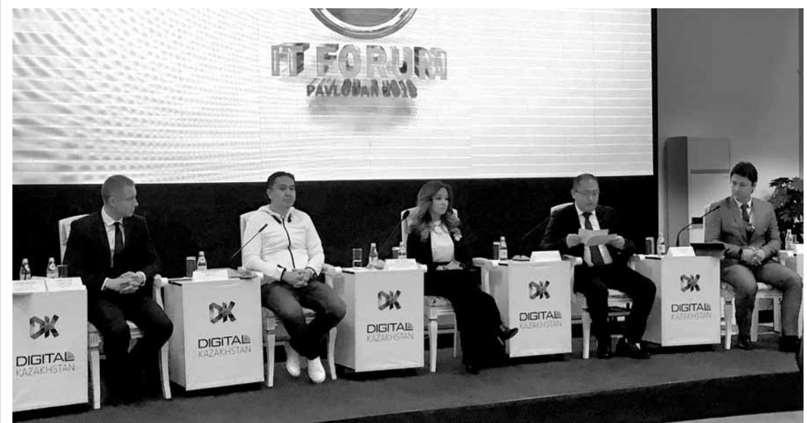
Организаторы IT-форума надеются, что он послужит толчком для развития бизнеса.