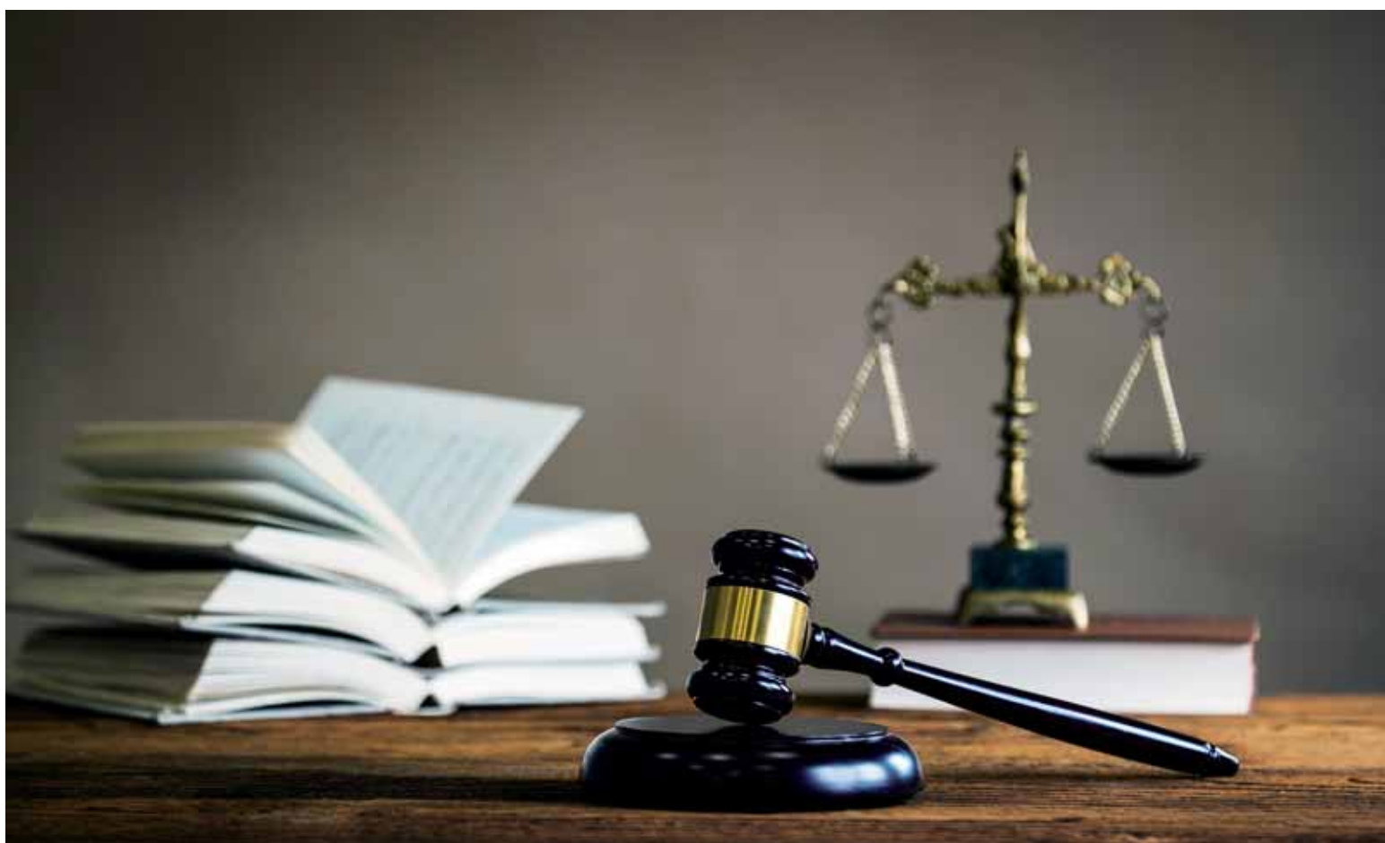
Спорные вопросы по налогам привели к приостановке работы АО «Майкаинзолото». Чью сторону поддержит суд, пока неизвестно.