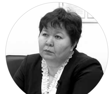
«Жители области стали больше хранить деньги на банковских счетах».

При этом банкиры в очередной раз напоминают, что, прежде чем