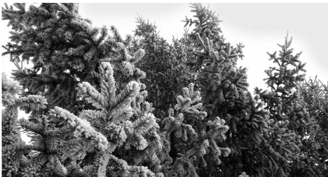
Последний раз желающего украсить свой праздник незаконно срубленной живой елью поймали в 2017 году.

В СКО в преддверии новогодних праздников пытаются спасти хвойный молодняк от браконьеров