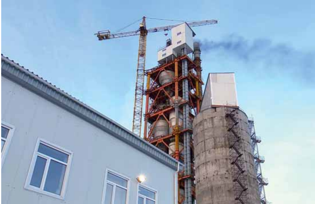
В Рудном запустили в работу цементный завод, который строился почти 6 лет.

Открытый на днях в Рудном цементный завод стал первым таким предприятием в Костанайской области. Строительство этого объекта началось 6 лет назад и было приостановлено из-за нехватки средств. Как сообщили в региональном акимате, первоначально стоимость проекта оценивали в 12 млрд тенге, затем сумма выросла до