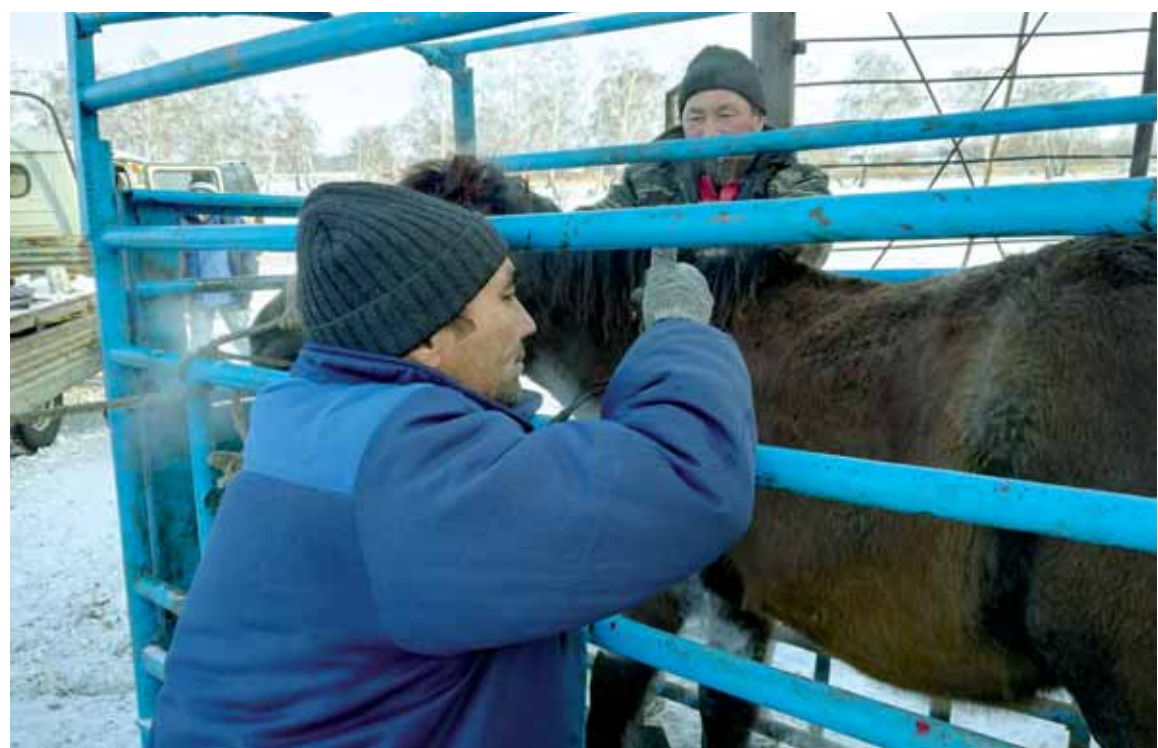
Тавро не только помогает устанавливать похитителей скота, но и способствует скорому разрешению частных споров, касающихся принадлежности животного.

В ноябре текущего года в сенате парламента обсуждали проблему скотокрадства и озвучили данные Генеральной прокуратуры РК, согласно которым с 2015 по 2017 год зарегистрировано больше 21 тыс. фактов кражи животных. Раскрыто чуть больше 38% дел. Нанесенный потерпевшим ущерб составил свыше 3,5 млрд тенге, и из этих денег возмещено менее половины.